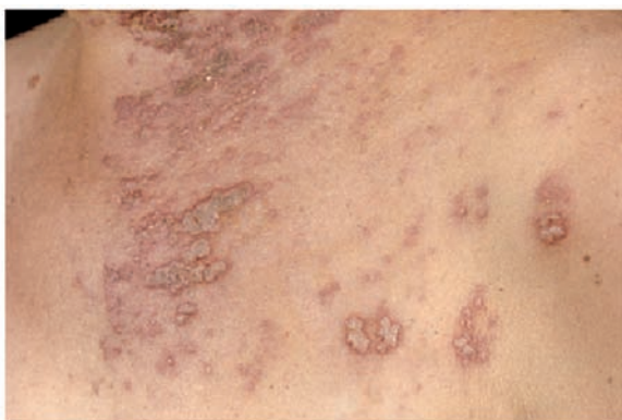
Figura 1. Vesículas y pústulas típicamente arracimadas en el dermatoma afectado por el herpes zóster

Las primeras lesiones suelen iniciarse en el punto más cercano al sistema nervioso central, para en días sucesivos ir apareciendo las nuevas lesiones siguiendo el trayecto del nervio (situándose en el área de la piel inervada por una sola raíz nerviosa dependiente de un ganglio medular sensitivo). (41)