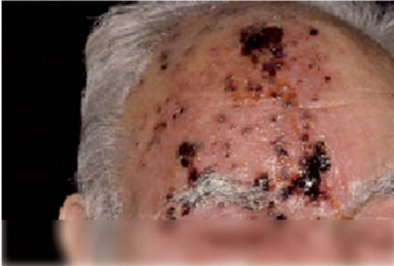
Figura 2. Herpes Zóster en 1ª rama del trigémino

nes de la enfermedad y constituye un problema relativamente común en los ancianos. (47)