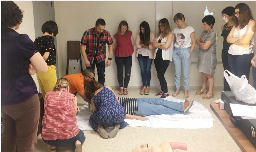
Taller de politrauma con el equipo del 061 y urgencias extrahospitalarias.

El sexo sigue siendo tabú y más aún siendo mujer.