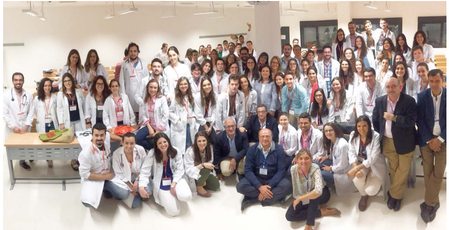
Algunos de los alumnos que realizaron la ECOE.

La cátedra de SEMERGEN y la Universidad de Extremadura (UEX), cátedra SEMERGEN-UEX, en colaboración con la Facultad de Medicina y la Gerencia del Área de Badajoz del Servicio Extremeño de Salud, celebraron los días 1 y 2 de junio la Evaluación Clínica Objetiva Estructurada (ECOE) correspondiente al curso académico 2017-18. Una prueba que pone de manifiesto una vez más la implicación de SEMERGEN con la Universidad y la formación pregrado.