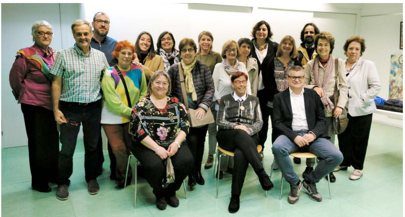
Esta primera experiencia ha tenido una excelente acogida.