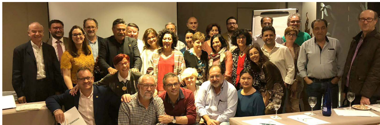
Algunos de los investigadores que forman REDI.

Se han presentado los estudios de investigación que está poniendo en marcha la Agencia de Investigación durante 2018.