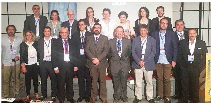
Algunos de los asistentes posan para la foto de familia.

“Además, este programa también nos mantiene informados y en constante alerta sobre noticias procedentes de la literatura médica y bulos acerca de la salud en internet. Esto es especialmente importante para los residentes, pues fomenta su espíritu crítico y sus habilidades de comunicación” ha explicado el miembro del Grupo de Trabajo de Nuevas Tecnologías de SEMERGEN.