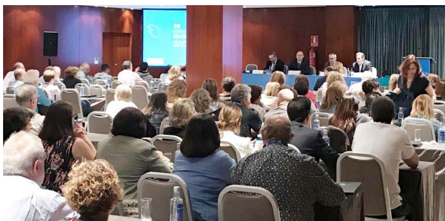
Sala llena de congresistas adquiriendo competencias y conocimientos.

“Después de estos años al frente de SEMERGEN Galicia como vicepresidente y, ahora, como presidente autonómico, nuestro futuro pasa por la investigación de calidad y por la formación continuada, sin olvidarnos de la defensa de una AP fuerte, preparada para los retos del futuro y reconocida”, ha finalizado el presidente de SEMERGEN Galicia.