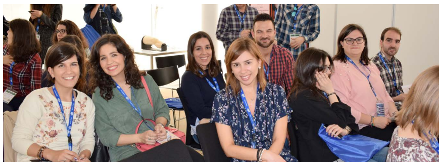
Sonrientes participantes del encuentro.

El programa científico ha recogido conocimientos y habilidades con el objetivo de mejorar la resolutivez de los médicos.