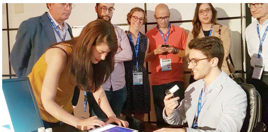
Probando wearables para patologías respiratorias.

Han contado con un total de 153 inscritos, sin contar con