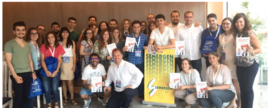
Esencia SEMERGEN residentes durante la 1ª Escuela de Verano.