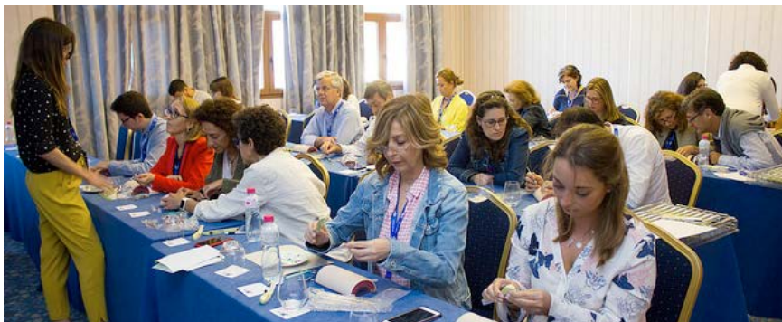
Los talleres prácticos, protagonistas del programa científico.

A través del lema “Nuevos retos, nuevas ilusiones”, se manifiesta la esencia de la AP y su necesaria renovación.