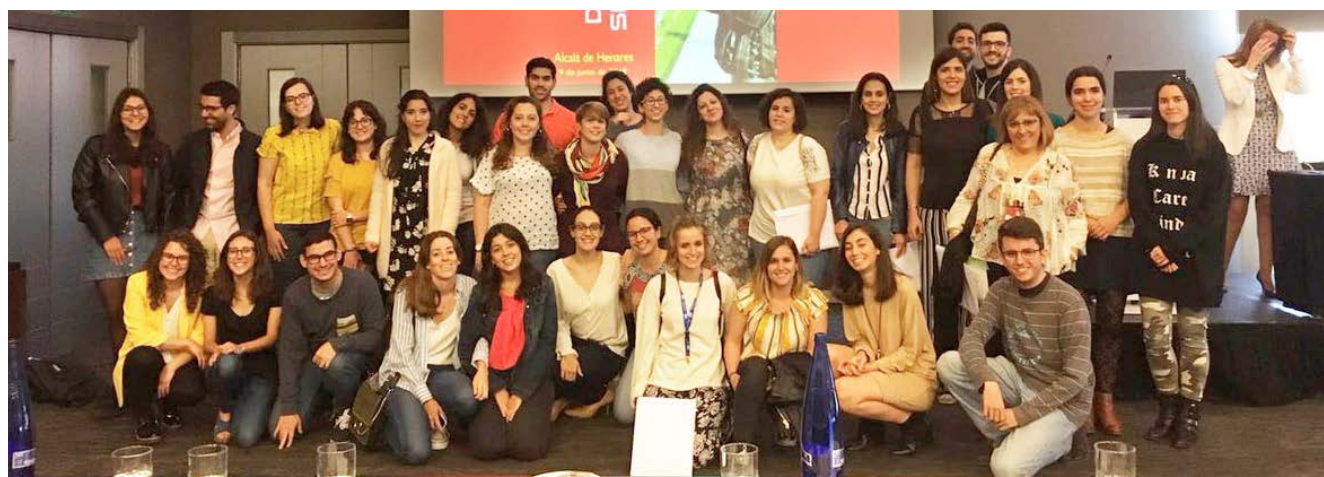
Los residentes, protagonistas indiscutibles de las Jornadas.

A partir de esta primera impresión diagnóstica, el residente debe plantearse los posibles diagnósticos diferenciales de los pacientes, y solicitar las pruebas complementarias que precise de manera eficiente, confirmar su hipótesis diagnóstica, y establecer un plan terapéutico optimizado desde el punto de vista de la eficiencia. “Estas situaciones pueden resultar especialmente complicadas durante los primeros meses”, ha manifestado el presidente del Comité Organizador.