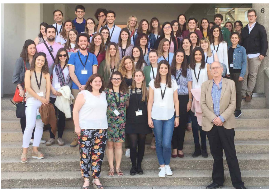
Foto de familia con los asistentes.