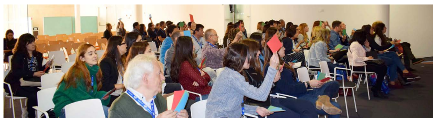
Momento durante una sesión científica.

El programa científico, puesto en marcha por 45 profesionales de la salud, ha recogido multitud de competencias y se ha creado con