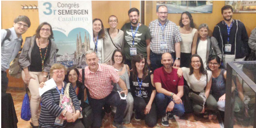
Miembros de los Comités y asistentes.

Se ha remarcado la importancia de los sentimientos y la positividad en la profesión del médico de Familia.