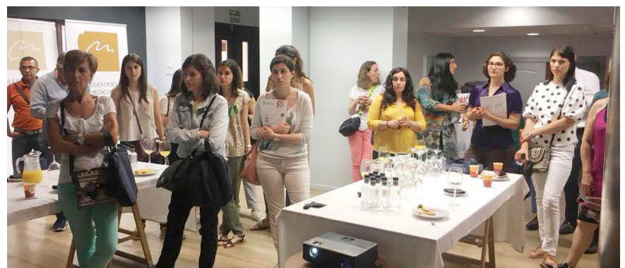
Momento durante las comunicaciones científicas.

“El deseo masculino es más directo; un estímulo visual puede ser suficiente para que se active. Sin embargo, el deseo femenino es más emocional y se influencia de muchos factores, por lo que se debe conseguir la intimidad emocional con el objetivo de que desee la relación sexual”, ha finalizado la presidenta de SEMERGEN La Rioja.