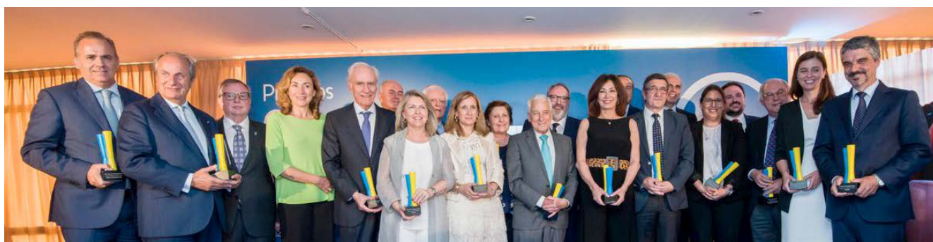
Todos los premiados posan con su galardón.