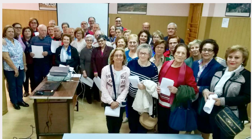
Momentos después de la formación.

También se ha hablado sobre el manejo de fármacos orientados al abordaje del dolor como síntoma principal del cuadro de artrosis, y, en el caso de la osteoporosis, se ha insistido especialmente en la importancia de la prevención primaria y minimizar el riesgo de fracturas.