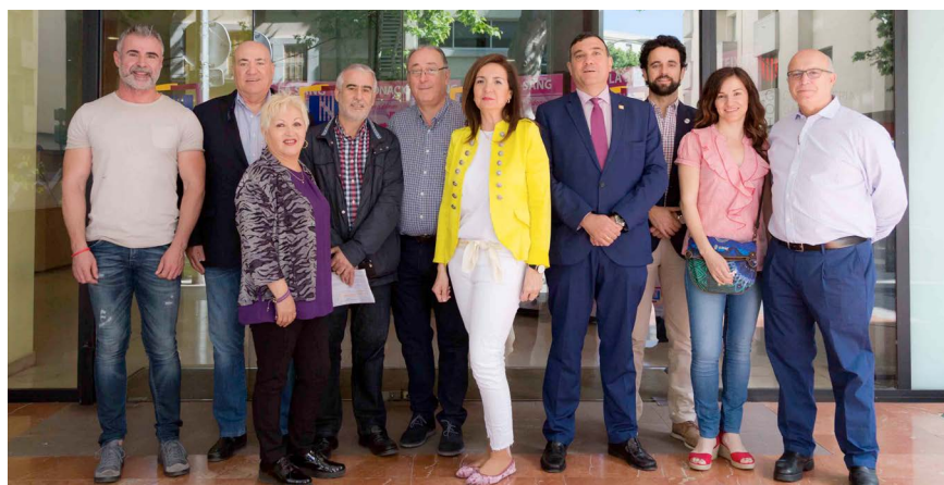
Ilusión y entusiasmo, los valores clave de los miembros de los Comités.

Absolutamente. Dispondrán de actividades paralelas al Congreso cuyo objetivo será dar a conocer actividades de Pacientes SEMERGEN, ONGs y asociaciones de pacientes. Estas actividades consistirán en concienciar tanto a esta población general como al colectivo médico sobre la importancia de las donaciones de sangre, así como instruir en RCP básica y visualizar la necesidad de colaboración entre los diferentes cuerpos de seguridad del estado ante un accidente grave, con una demostración de la extricación.