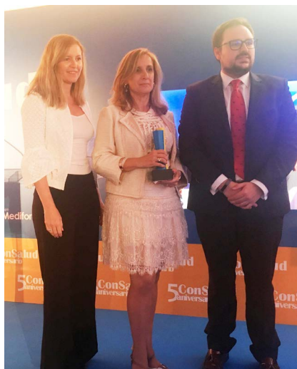
Momento de la entrega del reconocimiento.

“Por su compromiso en la actualización de los médicos de Atención Primaria, su apuesta por el abordaje de la cronicidad, la potenciación de este nivel asistencial en la universidad y por su lucha incansable por la Atención Primaria en España. SEMERGEN se ha convertido así en un referente para los profesionales de la Medicina de Familia”. Con estas palabras el Grupo Mediforum hacía entrega a SEMERGEN del galardón correspondiente a “Sociedad Científica del Año” en el contexto de los V Premios ConSalud 2018. Unos premios que reconocen las iniciativas y personalidades que han destacado por su contribu-