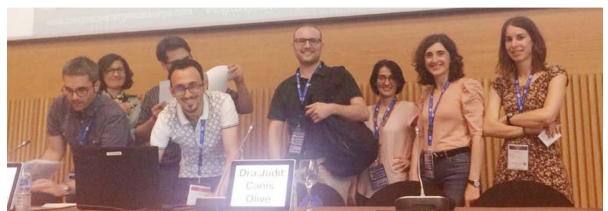
Residentes preparando sus ponencias.

Así, se debe hacer especial énfasis en la necesidad de una buena planificación dietética que garantice una alimentación equilibrada ya que este tipo de dieta mal aplicada puede conllevar varios déficits nutricionales, el más grave, el déficit de Vitamina B12.