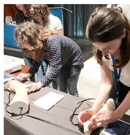
Taller práctico de infiltraciones.