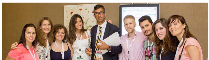
Satisfechos asistentes tras presentar sus comunicaciones orales.

Otra de las mesas destacadas ha tratado los nuevos modelos para la continuidad asistencial en la atención al paciente crónico, en donde se ha hablado sobre los retos de la continuidad asistencial.