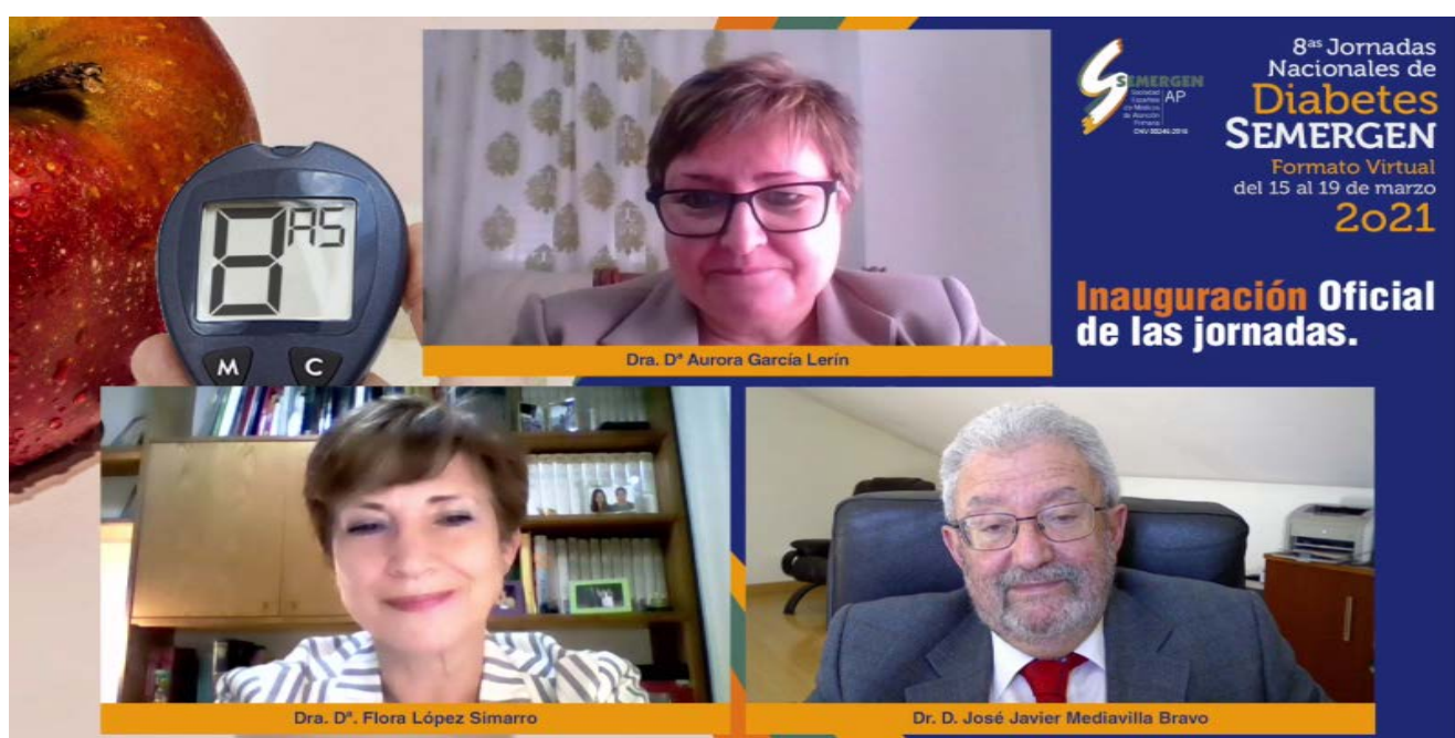
Detalle de la Inauguración de las Jornadas

Además de esto, hay que hacer hincapié en la educación terapéutica en Diabetes Mellitus, tanto con la alimentación como con la actividad física, la adherencia a la medicación, la prevención de las complicaciones y la potenciación del autocuidado. De esta manera, se conseguirá que las personas con Diabetes sean capaces de realizar automonitorización de peso, glucemia, presión arterial, revisión de los pies y acudir a su médico ante cualquier signo de alarma.