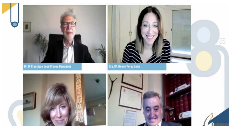
Logotipo del nuevo proyecto digital de formación de MSD para profesional

Las cifras del encuentro científico son excelentes, con más de 200 inscritos, de los cuales 40 son médicos residentes y alrededor de 80 comunicaciones presentadas, confirman a las 8ª