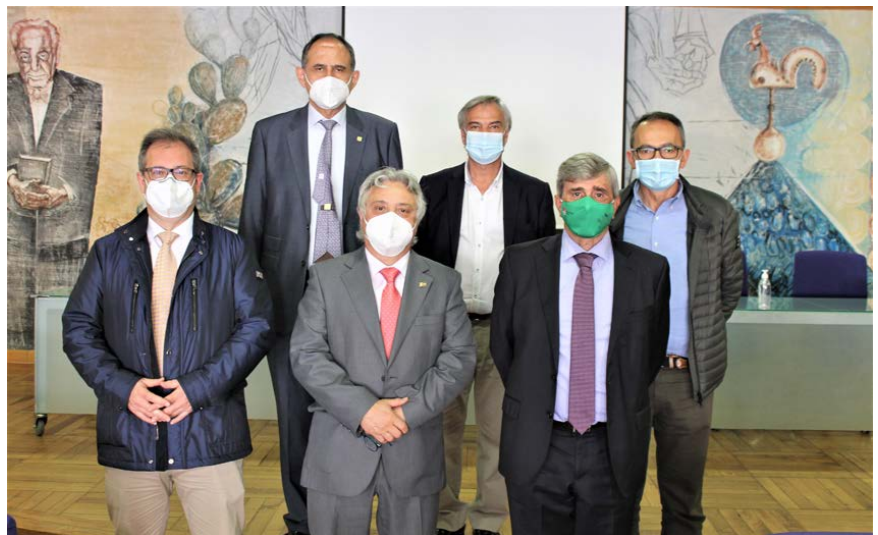
Foto de familia SEMERGEN - ULE

Por todo ello, y con la renovación hoy suscrita, se desea "ampliar la colaboración con la puesta en marcha de un Máster de investigación y un programa de doctorado que estará dirigido a los profesionales de la Atención Primaria".