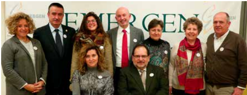
Han participado en este encuentro representantes de OMC, CESM, SEMERGEN, semFYC, SEMG, AEPap y CEEM.

La sede social de SEMERGEN ha acogido este 20 de diciembre la celebración de la última reunión del año que han tenido los principales representantes del Foro de Médicos de Atención Primaria, con el tema de la troncalidad como principal aspecto a valorar.