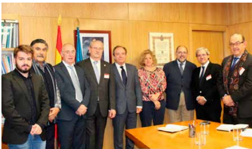
Foto de familia de los asistentes a la reunión.

La petición de diálogo que hace meses lleva planteando el Foro de Médicos de Atención Primaria al Ministerio de Sanidad, para tratar de buscar una solución óptima al proyecto de Troncalidad parece haber surtido efecto.