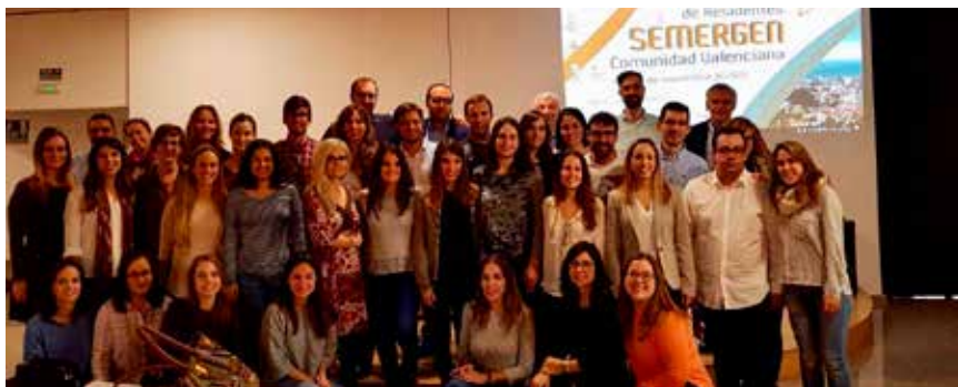
A la izqda., inauguración de las Jornadas de Euskadi; arriba, foto de familia de algunos participantes en la reunión de la Comunidad Valenciana; abajo, detalle de asistentes a las jornadas de Illes Balears.

Por su parte, acercar a los futuros médicos de Familia la práctica clínica en situaciones de emergen-