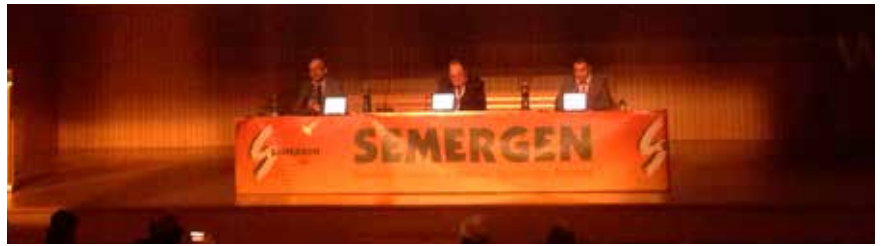
Destacado éxito del V Congreso de SEMERGEN Aragón.

El programa científico del V Congreso ha incluido como novedad dos talleres prácticos, con el objetivo de mejorar habilidades con simuladores y centrados en ámbitos tales como la electrocardiografía, el diagnóstico de arritmias, y la vía periférica venosa e intraósea. "Estas materias cobran especial relevancia dentro de las habilidades propias del médico de Familia, sobre todo teniendo en