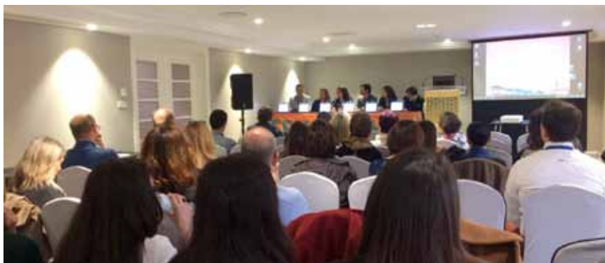
Importante asistencia al Congreso anual de SEMERGEN Cantabria.

Unos 200 profesionales han asistido al 13º Congreso Autonómico de SEMERGEN Cantabria, celebrado del 23 al 25 de noviembre en Santander, y donde se han presentado más de 200 comunicaciones, algunas de ellas procedentes del estudio IBERICAN.