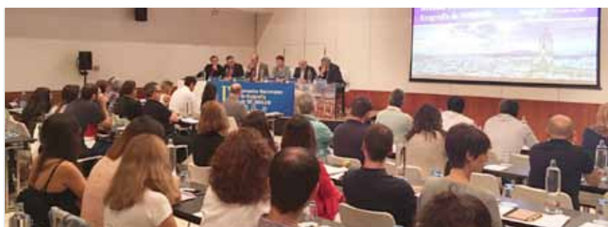
Destacada asistencia al IV Jornadas Nacionales de Ecografía de SEMERGEN.

Una reivindicación clásica del Grupo de Ecografía de SEMERGEN es la escasa disponibilidad de ecógrafos en Atención Primaria. En las IV Jornadas Nacionales de Ecografía se ha vuelto a poner de relieve este problema.