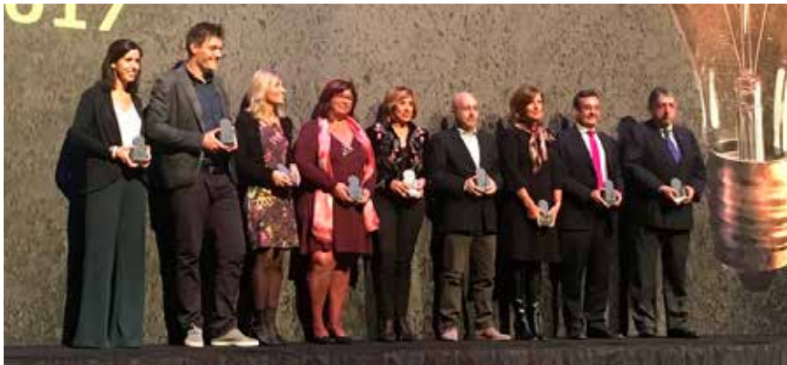
Foto de familia de los ganadores.

Como en ediciones anteriores del certamen de 'Mejores Ideas', que organiza desde hace 16 años 'Diario Médico, una iniciativa en la que ha colaborado SEMERGEN ha resultado merecedora de un premio.