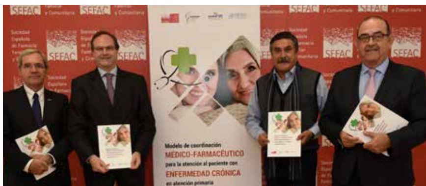
Acto de presentación del documento.

La colaboración entre SEMERGEN, la Sociedad Española de Farmacia Familiar y Comunitaria (SEFAC), la Sociedad Española de Medicina de Familia y Comunitaria (semFYC) y la Sociedad Española de Médicos Generales y de Familia (SEMG) ha permitido la elaboración de un modelo de coordinación médico-farmacéutico para la atención al paciente con enfermedad crónica en Atención Primaria.